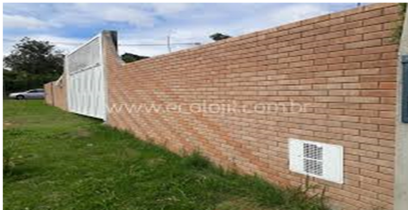
Figura 2 EXEMPLO DE MURO DE TIJOLO