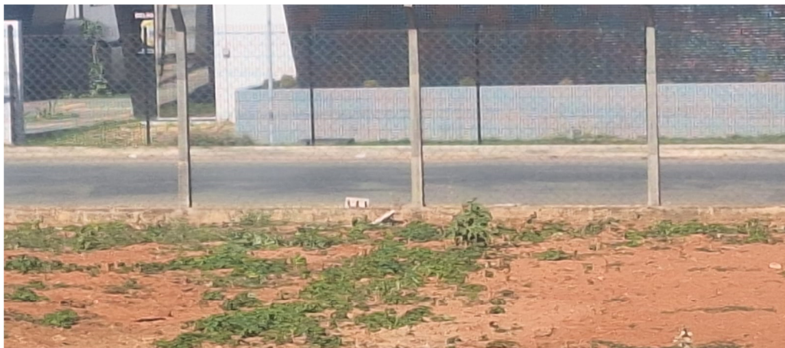
Figura 4 CERCA FRONTAL ANTIGA PRESENTE

utilizado ser feito de metal/aço galvanizado possui uma baixa manutenção e alta durabilidade. Ao contrário da cerca de madeira que exige uma manutenção constante e não durabilidade com mudanças de durabilidade e temperatura, situação que ocorre em muito na região.