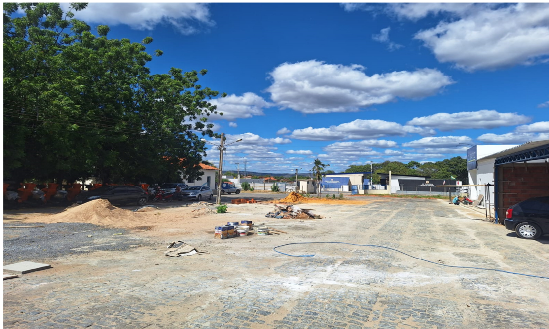
Figura 5 Area dividida entre o CIBARC (a dir.) e o DPT (a esq.)