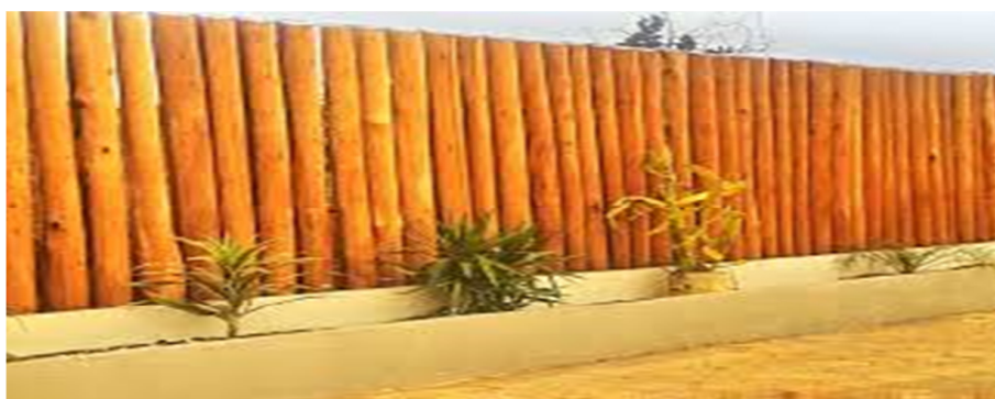
Figura 1 EXEMPLO DE CERCAMENTO DE MADEIRA

Em contrapartida, necessita de uma manutenção frequente e baixa resistência a mudança de temperatura e umidade, ações que são presentes na região.