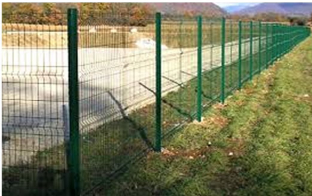
Figura 3 EXEMPLO DE GRADIL