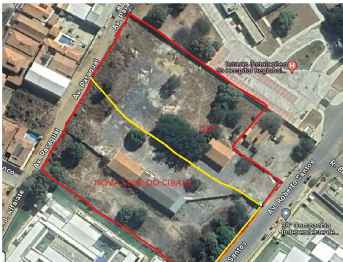
Figura 6 Vista aérea da área compartilhada entre o CIBARC (esq.) e a DPT (dir.) Marcação em amarelo da futura instalação do GRADIL